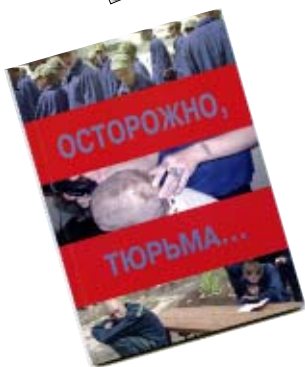
Издания Центра содействия по профилактике правонарушений несовершеннолетних и молодежи.