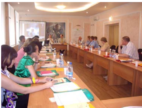
Воронеж. «Социальная реабилитация лиц, освобождающихся из мест лишения свободы: региональный аспект». Июнь 2009

«...Нужны и специальные меры социальной реабилитации, эффективные меры социальной реабилитации для лиц, которые отбыли наказание. Без участия региональных властей эту задачу не решить, и это ещё одна причина, по которой этот вопрос сегодня рассматривается на заседании президиума Государственного совета. В тех регионах, где этим вопросом активно занимаются, где ведут такую работу, уровень преступности снижается. Напомню, что каждый год из мест лишения свободы, из мест заключения освобождается в среднем до 300 тысяч человек. При этом мы, конечно, должны обращать внимание на так называемую повторность, или рецидив, в совершении преступлений. Конечно, взаимосвязь между рецидивной преступностью и мерами социальной реабилитации, безусловно, прямая и очевидная.