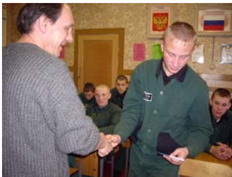
Вручение записной книжки осужденным Бобровской ВК