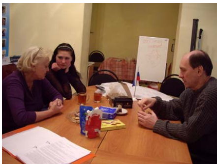
Обсуждение проблем освободившей девушки в организации «Гражданская инициатива» в Златоусте.