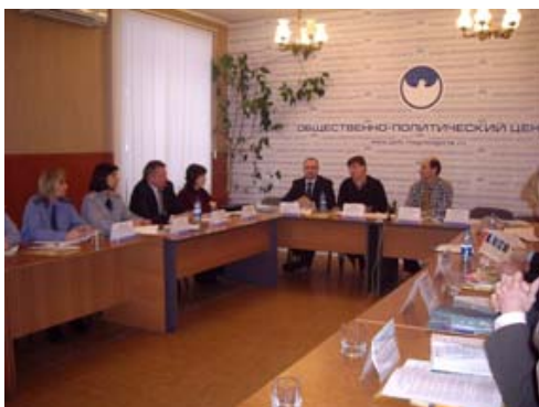
Магнитогорск. «Социальное сопровождение молодежи до и после освобождения»