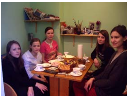
Сопровождение в Москве четырех освободившихся из НВК девочек. Справа – волонтер Центра. Февраль 2009.

колонию ИК-5 в г. Челябинске (в апреле, июле, декабре 2009 г.) и работать с теми девушками, уроженками Челябинской области, которые были переведены из НВК в ИК-5 по достижению 19 лет. Таковых насчитывается примерно 30 человек, многие по-прежнему ждут от нас помощи, т.к. какие-то их проблемы так и остались нерешены в связи с переводом в другую колонию. Таким образом, сопровождение этих девушек, работа с которыми была начата еще в Новом Осколе, продолжается в новых тюремных условиях. Кроме того, по социальным вопросам к нам начали обращаться и взрослые женщины в этой колонии. Надо отметить, что во взрослой колонии подобная деятельность еще более актуальна, т.к. на 1500 осужденных в ИК всего 2-3 социальных работника. Локальная система колоний и большая численность затрудняют доступ обращений осужденных к социальному работнику.