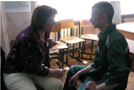
Тренинги по медиации в воспитательной и женской колониях Орловской области.

Работа в этом направлении проводится в рамках проекта «Развитие элементов ювенальной юстиции для несовершеннолетних группы риска: сотрудничество государственных служб и общественных организаций на межрегиональном и международном уровне (Ленинградская, Иркутская и Орловская области, Тверь и Москва)», финансирование Европейской Комиссии и Каритас-Франция, 2008-2010 гг. Координатор: Л. Альперн