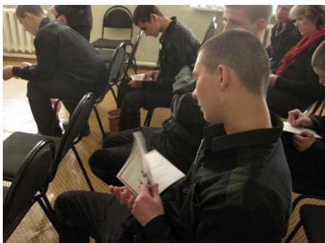
Проведение профилактических занятий в Можайской ВК.