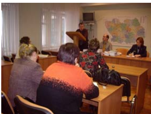
Пенза, декабрь 2009. Доклад на семинаре районных КДН и ЗП Пензенской области.