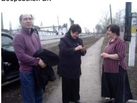
Мониторинг и посещение семей освободившихся из Бобровской ВК.

реабилитационный центр для бывших осужденных).