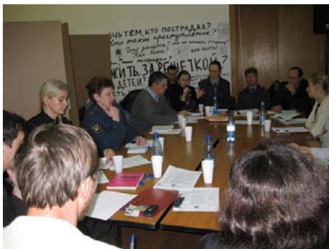
Круглый стол в рамках «Non Fiction» - «Несовершеннолетние правонарушители: помогать или наказывать?» 2-6 дек. 2009.