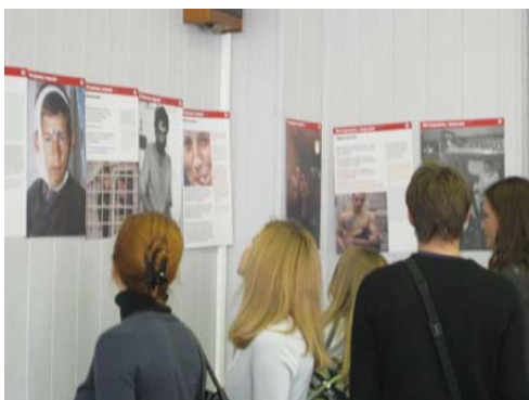
Учебное занятие на факультете психологии МГУ – по программе «Осторожно, тюрьма». Ноябрь, 2009.

Результаты мероприятия «Итоги и предложения» доведены до губернатора Воронежской области, Комиссии по делам несовершеннолетних, Общественной палаты, ГУФСИН Воронежской области. Была отмечена взаимосвязь необходимости перехода к новому качеству работы с осужденными в период отбывания наказания в местах лишения свободы и социальной адаптации после освобождения, без решения первой задачи программы адаптации не будут эффективны.