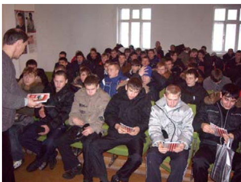
Златоуст. Беседа с подростками «У меня был условный срок».